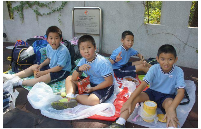
開飯啦！大家盡情吃呀！