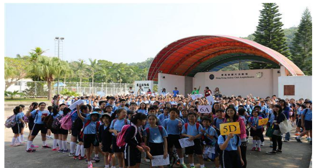
大家精神抖擻地集隊