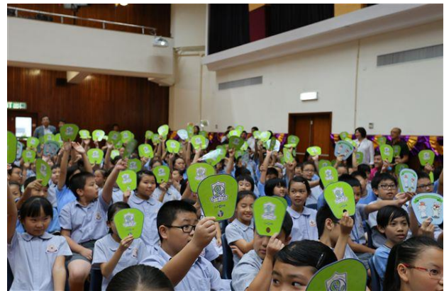
同學們踴躍地參與互動遊戲