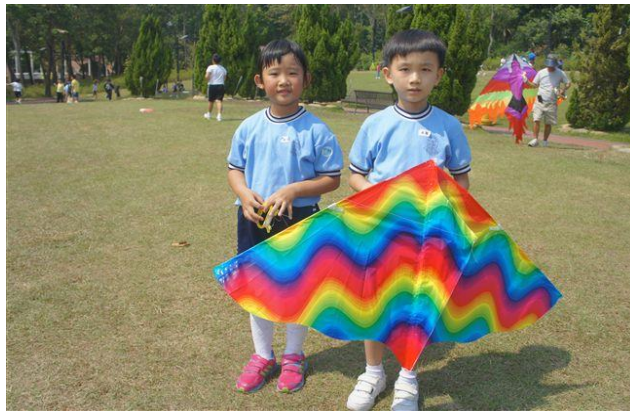
你猜我的風箏飛得多高？