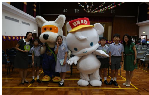
馬校長、石老師及環保大使同力力、Polar 合照