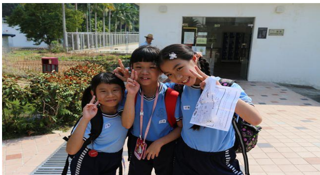
一、二、三，笑！ 我們笑得多燦爛！