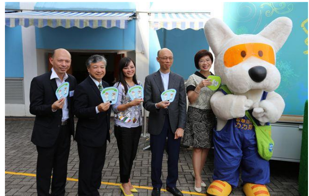
嘉賓們與 Polar 合照