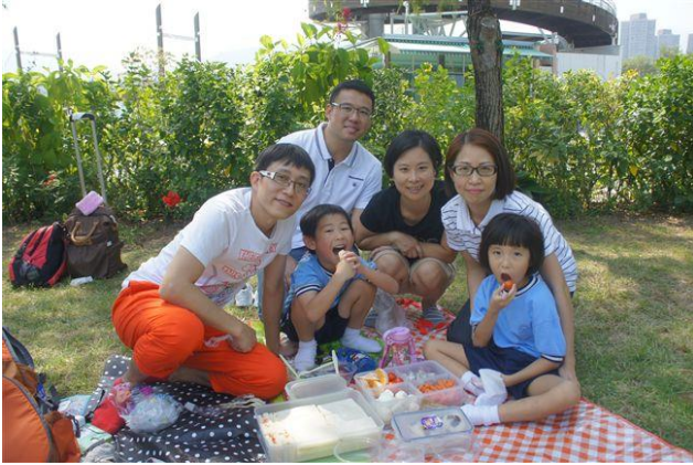
一家人野餐多開心！