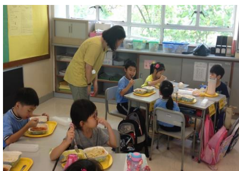
同學吃得很開心呢！